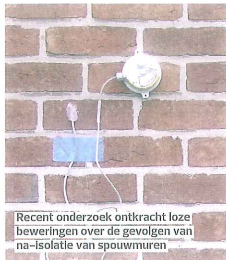
Recent onderzoek ontkracht loze beweringen over de gevolgen van na-isolatie van spouwmuren